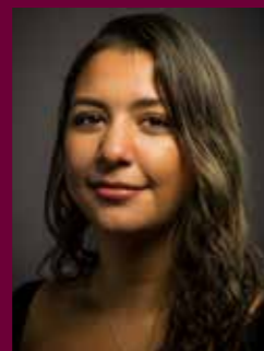
Farah EN AF OS-ambassadør

Talken afholdes i samarbejde med Alkohol & Samfund.