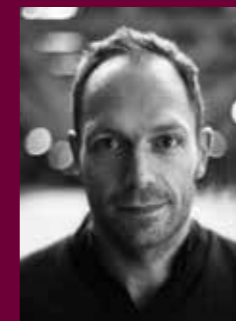
Kasper Hvidt Rådgiver og foredragsholder