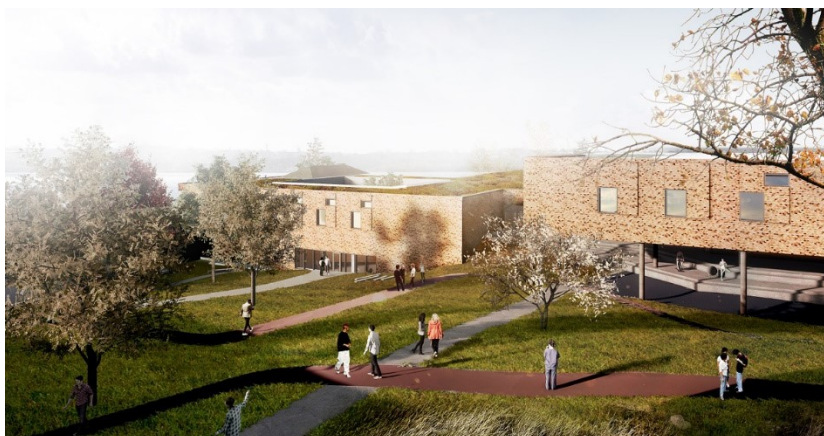
Visualisering af parken i Udsigten

Bygningen er navngivet Udsigten og kommer til at rumme alle lukkede afsnit i den specialiserede retspsykiatri. Det betyder, at de lukkede retspsykiatriske afsnit på Psykiatrisk Center Sct. Hans og i Glostrup flytter ind i Udsigten i november 2021.