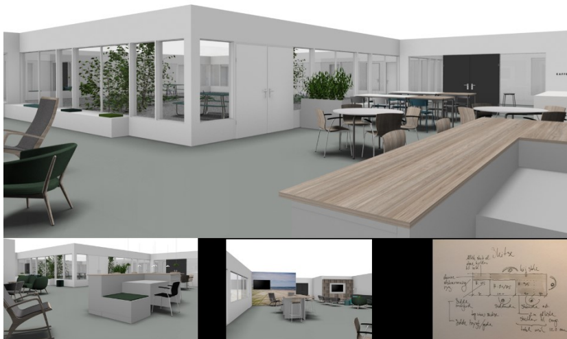
Visualisering af fællesområde i afsnit