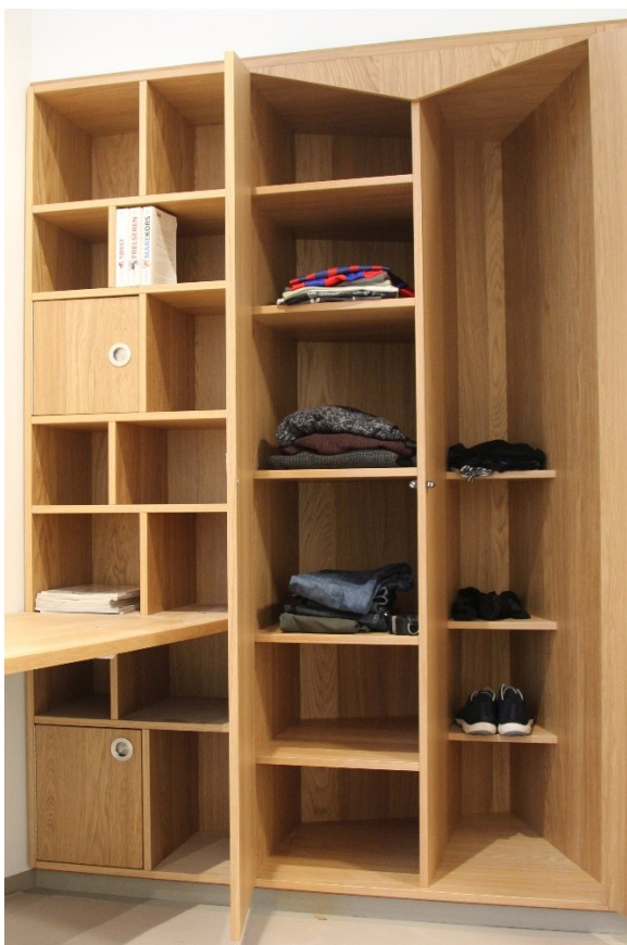
Indbygget reol og skab