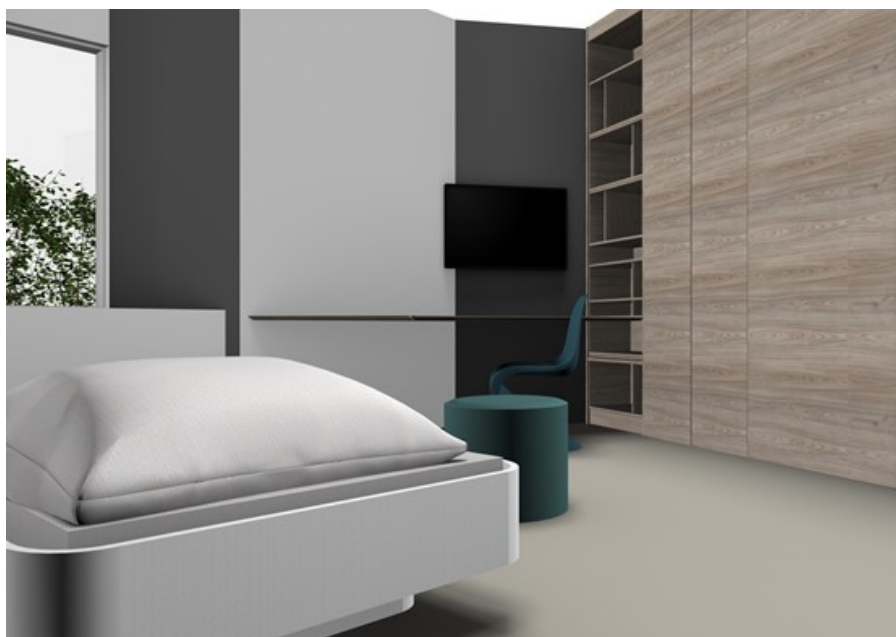
Sådan ser møblerne ud på stuen (modelbillede)

Personalet på dit afsnit hjælper dig med at blive klar til at flytte og sortere og pakke de ting, du kan have med.